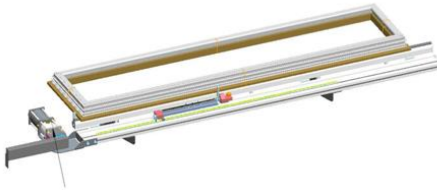
Máquina de perfuração opcional